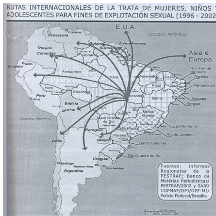
Figura 2 – Rotas internacionais de tráfico de mulheres, adolescentes e crianças para fins de exploração sexual (1996 – 2002)

O fenômeno do tráfico de crianças e adolescentes para fins de exploração sexual adquiriu grande visibilidade no Brasil a partir da realização pelo CECRIA, com apoio de diversas organizações nacionais e internacionais, da Pesquisa sobre Tráfico de Mulheres, Crianças e Adolescentes para Fins de Exploração Sexual no Brasil / PESTRAF-Brasil , concluída no ano de 2002. O relatório da pesquisa, além de articular aspectos jurídicos, sociais, políticos, macroeconômicos, culturais e psicológicos relevantes à compreensão do fenômeno, revela de maneira contundente o perfil de vítimas, dos aliciadores e das redes nacionais e internacionais de exploração sexual, apontando 241 rotas de tráfico de mulheres e adolescentes - intermunicipais, interestaduais e internacionais.