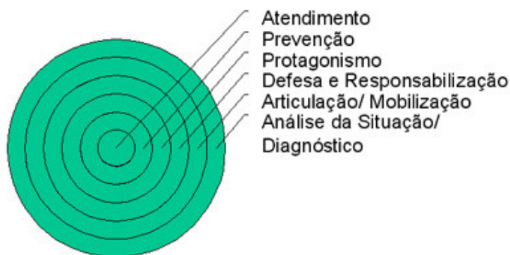
Figura 1 – Eixos estratégicos do Plano Nacional de Enfrentamento da Violência Sexual Infanto-Juvenil.

Apesar de todo o esforço nacional realizado nessa área até o presente, os problemas persistem em dimensões alarmantes, estimando-se entre 100.000 e 500.000 o número de crianças e adolescentes vítimas de exploração sexual comercial no Brasil 3 . Isto representa um enorme desafio à sociedade e ao Estado brasileiros, traduzido na necessidade do estabelecimento de políticas incisivas e abrangentes o bastante para produzirem o esperado impacto na redução substantiva ou, quiçá, na erradicação dessa verdadeira chaga nacional.